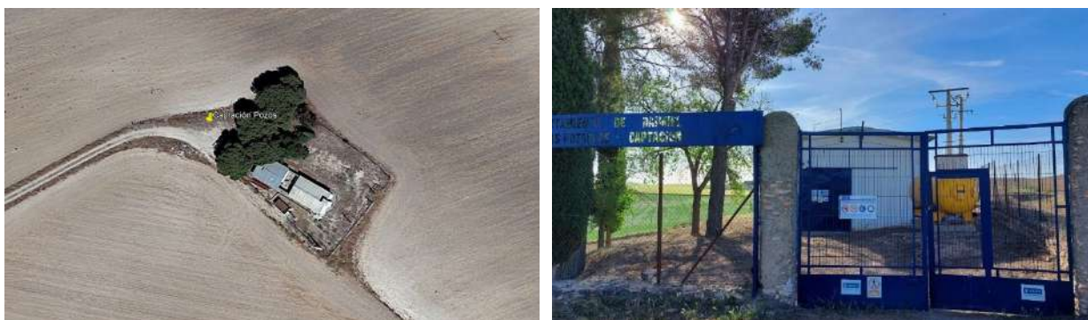
Figura 1. Localización y entrada a los pozos de captación de Ojos del Guadiana de Daimiel

El abastecimiento de agua procede de forma prioritaria de dos sondeos situados en el paraje conocido como "Ojos del Guadiana" localizados en las coordenadas X: 456.074.17 Y: 4.332.903,78, a unos 12 km. de la población (por la carretera. Nacional dirección a Puerto Lápice). El agua procede del Acuífero 23 definido en el Plan Hidrológico de la Demarcación Hidrográfica del Guadiana.